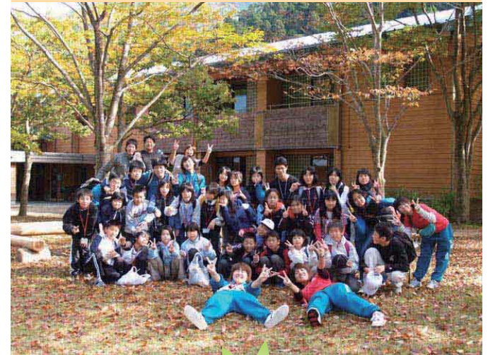
「小さい秋探検隊」 主催：葛川少年自然の家